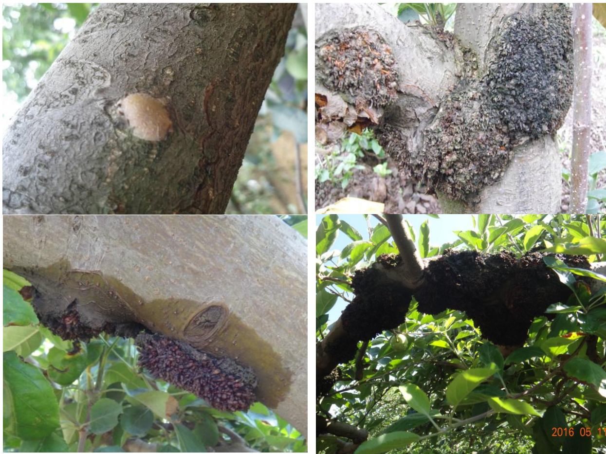
图 9-1 苹果疑似冠瘿病（气生瘤）在树上的症状表现

列扩增和测序，结果没有发现根癌土壤杆菌的存在，故排除了土壤杆菌是致病菌的可能性，表明该病为生理性病害。