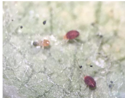
图 9-7 刚刚吃饱喝足的捕食螨（左）