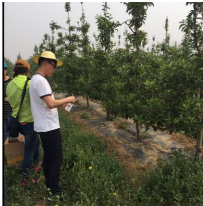
图 9-4 正在苹果园释放捕食螨