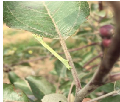
图 9-9 苹果叶上的大造桥虫