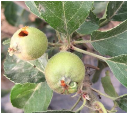
图 9-8 正在蛀食苹果的棉铃虫