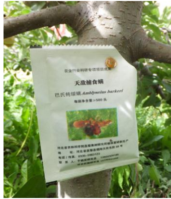
图 9-5 装有捕食螨的纸袋钉在枝干上