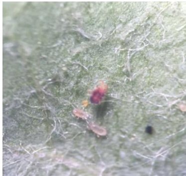
图 9-6 山楂红蜘蛛（红）和捕食螨（白）