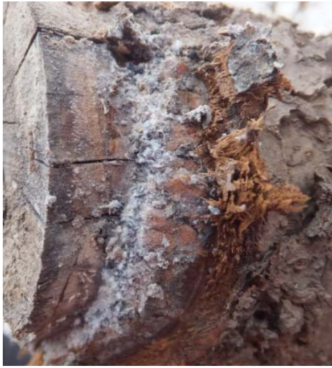
图 5-7 剪锯口处的苹果绵蚜