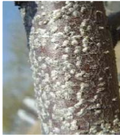
图 5-8 枝干上的桑盾蚧