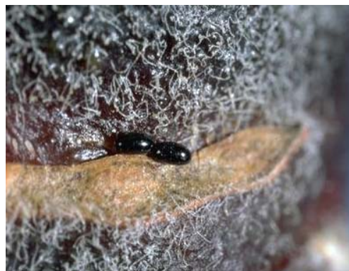
图 5-2 芽鳞痕处的苹果黄蚜越冬卵（黑色）