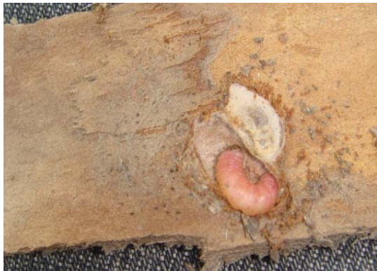
图 5-9 枝干老翘皮下苹果蠹蛾越冬幼虫