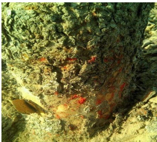
图 5-5 树干老翘皮下山楂红蜘蛛越冬雌螨（红色）（李晓荣）