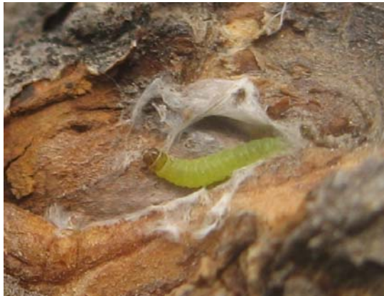
图 5-10 老翘皮下的苹小卷叶蛾越冬幼虫