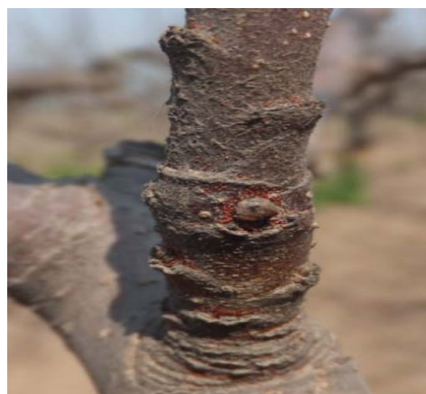
图 5-4 芽基部苹果全爪螨越冬卵（红色）