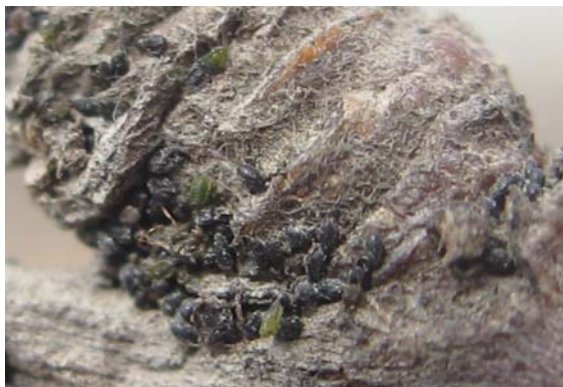
图 5-1 芽基部苹果黄蚜越冬卵（黑色）和刚孵化的小蚜虫（绿色）

6. 防控措施：如果调查发现果园内枝条上苹果全爪螨或苹果黄蚜的卵较多，或介壳虫（如桑盾蚧），建议在果树发芽前喷施 5 波美度的石硫合剂或 5% 矿物油乳剂。如果数量不是太多，可以等到果树花芽露红期所有越冬害虫都出蛰上树后喷施杀虫或杀螨剂。刮除老翘皮可以减少山楂红蜘蛛、苹小卷叶蛾以及梨小食心虫的越冬虫源基数。清除落叶可以减少金纹细蛾的越冬虫源。