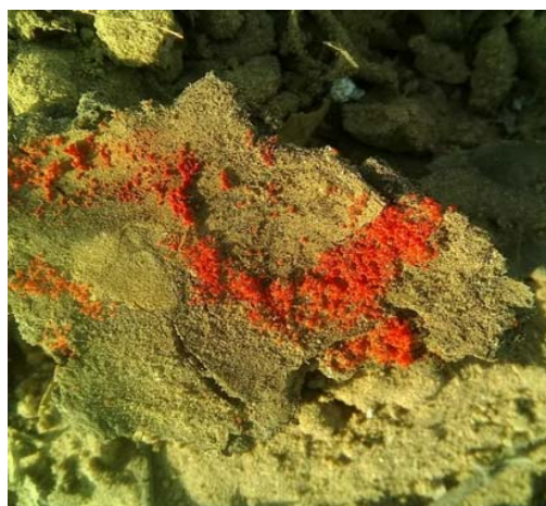
图 5-6 老翘皮下成堆山楂红蜘蛛越冬雌螨（红色）（李晓荣）