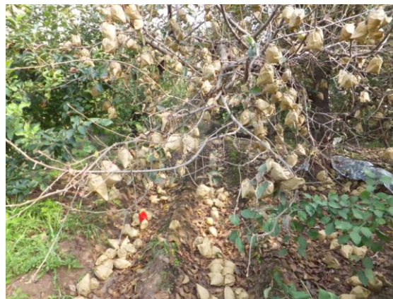
图 17-7 感染炭疽叶枯病的乔纳金造成的落果