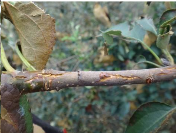
图 17-11 被冰雪砸伤的苹果树枝条