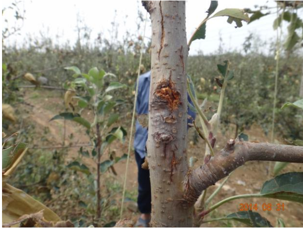
图 17-10 被冰雪砸伤的苹果树主干