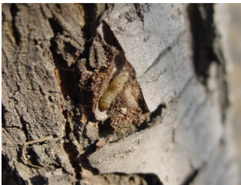
图 17-3 老翘皮下梨小食心虫越冬幼虫

上期报道了望都个别果园嘎啦发生炭疽叶枯病，近期望都许多果园内乔纳金苹果又大范围发生炭疽叶枯病，导致大量落叶（图 17-6），其次是黄香蕉和嘎啦，落叶还导致大量落果（图 17-7），损失严重。果实负载量越大的果树落叶、落果越严重。建议果农尽快采摘收获树上的果实，减少因落果造成的残次果损失，此外，还要清除落叶，减少果园内菌源。