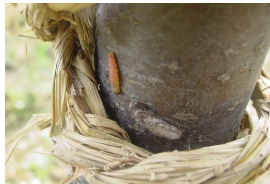
图 17-4 树干绑草绳诱集的梨小食心虫越冬幼虫