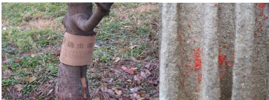
图 17-5 瓦楞纸幼虫带及其诱集的山楂叶螨越冬雌螨