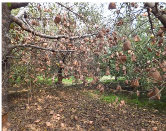
图 17-6 感染炭疽叶枯病的乔纳金叶片已经落光