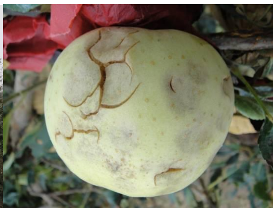
图 17-9 套袋苹果果实被冰雹砸伤状况