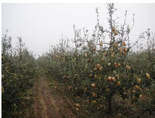
图 17-8 苹果园受雹灾整体状况

4、及时追肥，补充营养。灾后每株追施高氮高钾三元复合肥 1-2 斤，追肥后及时灌水，促进树体恢复，增强营养积累。同时结合喷药可加入 300-500 倍尿素和磷酸二氢钾或其他叶面肥进行叶面营养补充。