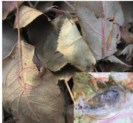
图 5-2 在落叶中越冬的金纹细蛾蛹（红圈内）