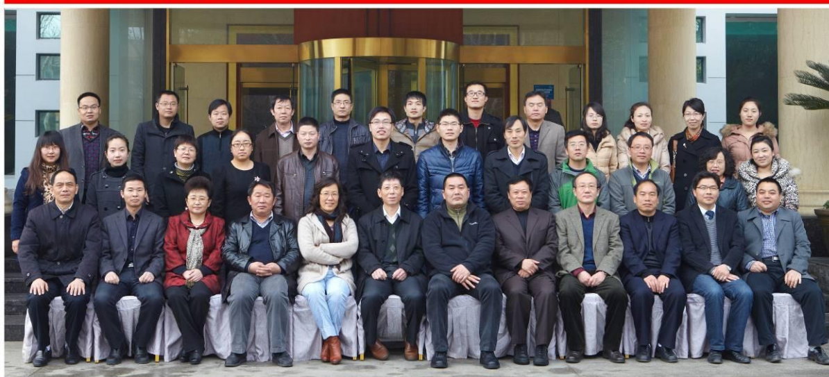
农业专项“果树腐烂病防控技术与示范”2012年工作总结会议领导专家合影 武汉·华中农业大学 2013.2