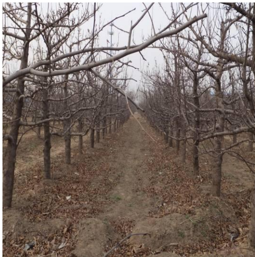
图 5-1 果园内地面上需要清除的枯枝落叶

针对腐烂病和轮纹病，我们建议结合修剪去除病枝等病残体，并将其带出园外。前期的研究已经证明，修剪是传播腐烂病的重要途径，因此，对较大的剪口和锯口一定要进行药剂消毒，具体可参照本期简报所介绍的防控方法。萌芽前可对树体喷施代森铵或树安康 1 次，后者除抑制枝干病原菌的发展外还能增强树势。