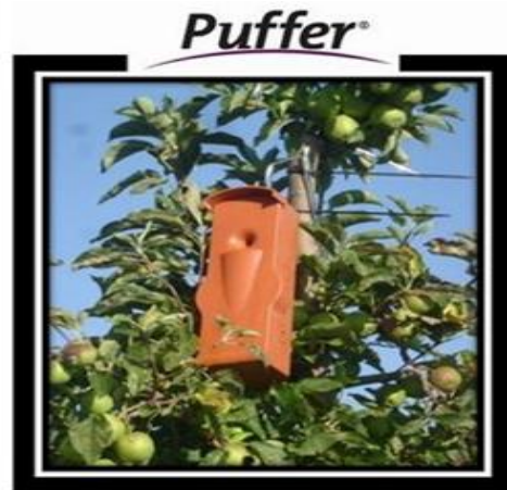
CheckMate Puffer® CM 自控性信息素发散器

此产品在欧洲是新产品，因为到目前为止只有 CS(胶悬剂，Suterra 公司独有的产品)，引诱剂和易蒸发制剂（由易挥发的气体制备）等剂型得到了批准。