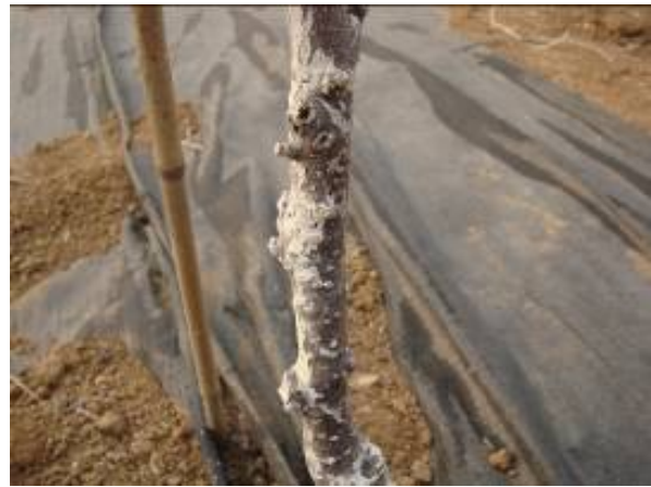
图 1-2 发生在中间砧上的轮纹病病瘤