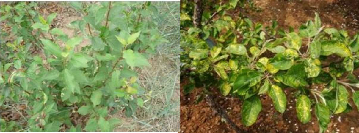
图 13-2 多株幼苗群发苹果花叶病