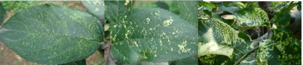
图 13-4 苹果花叶病症状表现