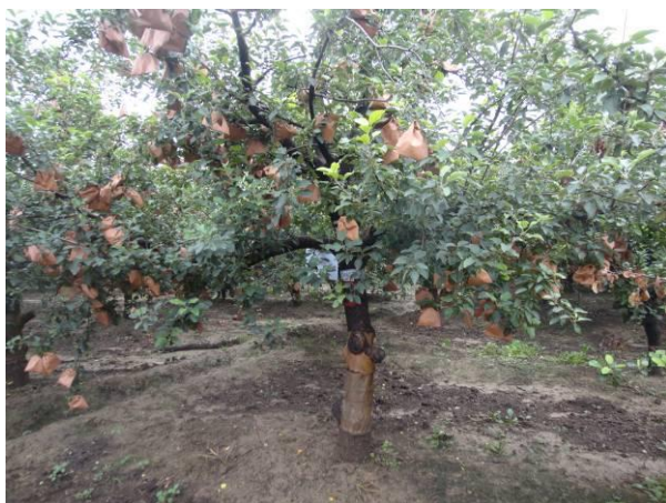
图13-5 经连续两年扒皮的苹果树