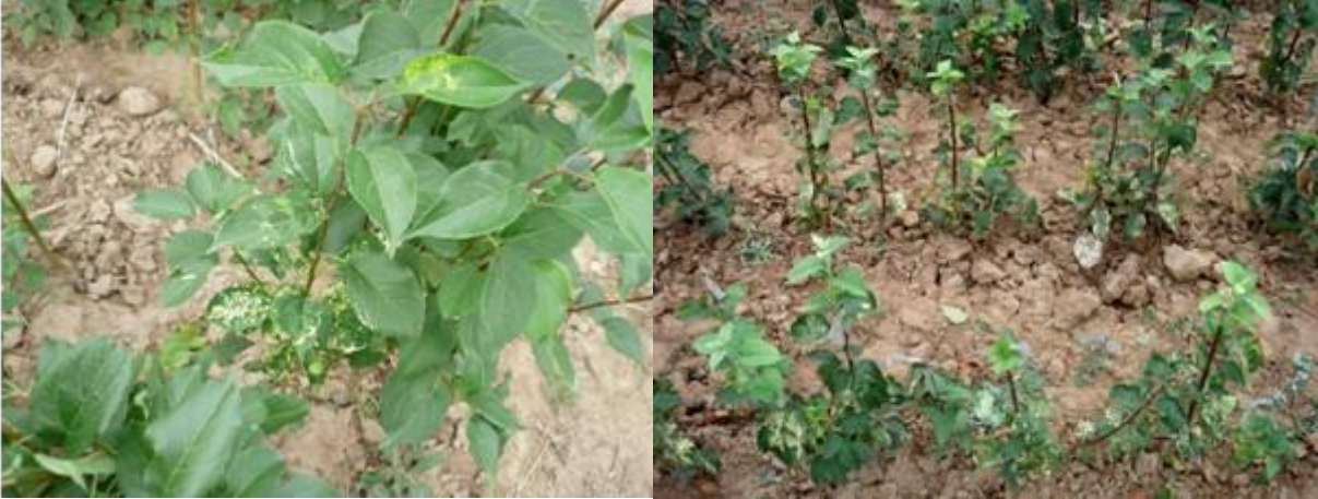
图 13-1 幼苗发生苹果花叶病

苹果花叶病的症状表现： 主要有 5 种类型，（1）花叶，苹果叶片上出现深绿、浅绿相间的病斑，形状不规则，边缘不清晰；（2）斑驳，叶片上出现黄色病斑，形状不同，大小不等，边缘比较清晰；（3）网纹，叶脉褪绿黄化，形成网纹状；（4）环斑，叶上出现黄色、近圆形斑纹或环斑；（5）边缘黄化，叶片边缘黄化，形成褪绿锯齿状镶边。这 5 种类型通常混合出现，在不同的品种和不同的病毒株系间有差异。