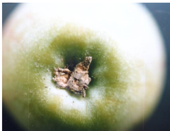
图 13-7 残腐花器上的粉红单端孢菌

粉红单端孢菌侵染苹果果心导致心腐型烂果，套袋后侵染果皮引起黑点病；链格孢菌侵染果心导致发霉，套袋后侵染果皮引起红点病；两种菌在一起时，粉红单端孢菌更强势。所以，无论是霉心病防治还是套袋黑点病防治，在选择药剂时，应把对粉红单端孢菌的控制作为重中之重。一些地区对霉心病防治很重视，例如河南三门峡市在苹果开花前专门召开了霉心病防控动员大会，70% 以上的果农都在花期喷施了药剂。通过了解，主要喷的药剂为多氧霉素或异菌脲，通过套袋前对二仙坡采集的幼果的剖查，发现防治霉心病效果很好，660 个果中没有一个霉心病果，但却有 50 个心腐果（7.6%）。对山东肥城套袋前幼果调查情况类似，红星霉心病 2.2%（3/135），心腐果 17.8%（24/135），富士心腐果 10%（35/349）。这些调查说明，套袋后发生黑点病的隐患还是存在的，今后需要调整思路和措施。