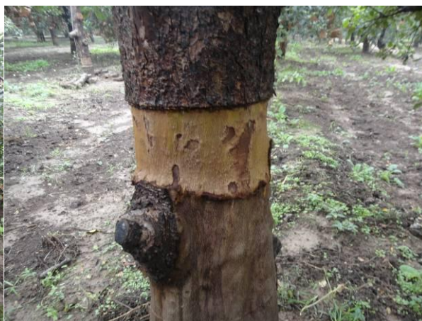
图13-6 扒皮4小时内遇雨皮层形成受到影响